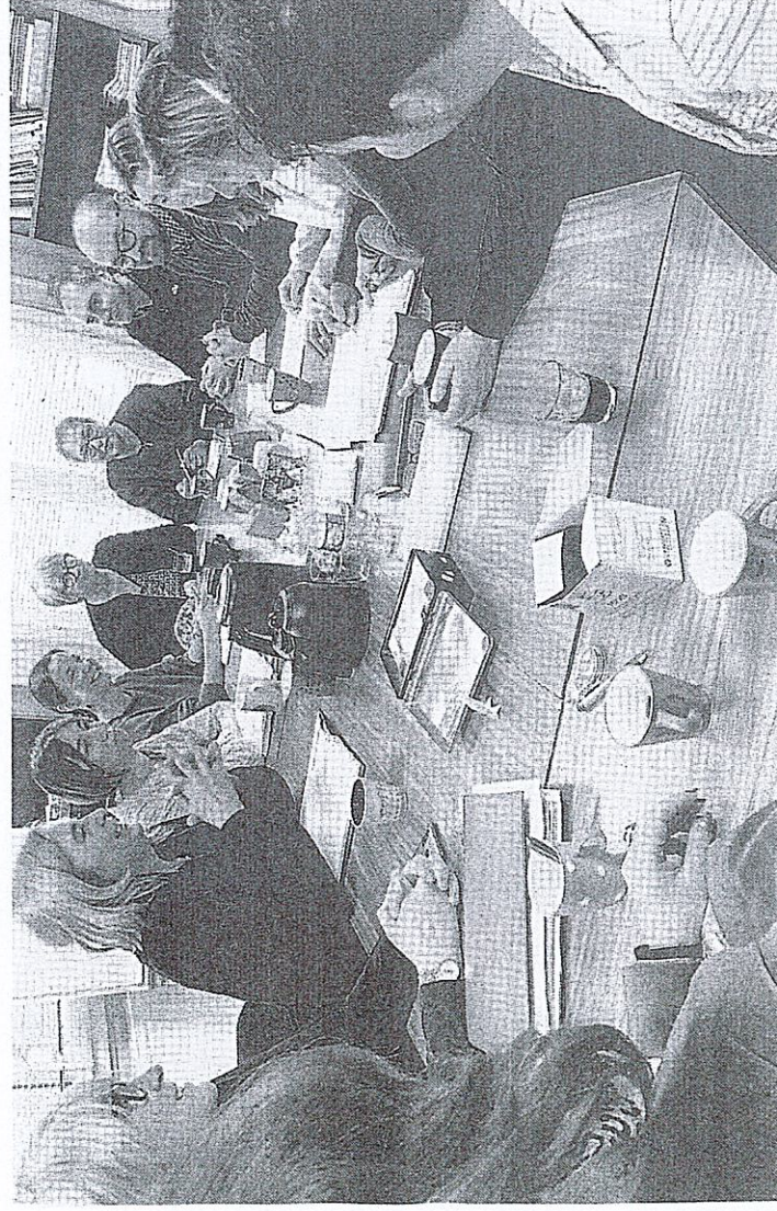
L'équipe de l'accueil d'urgence se réunit chaque jeudi : « Il peut se passer beaucoup d'événements d'une semaine à l'autre. »